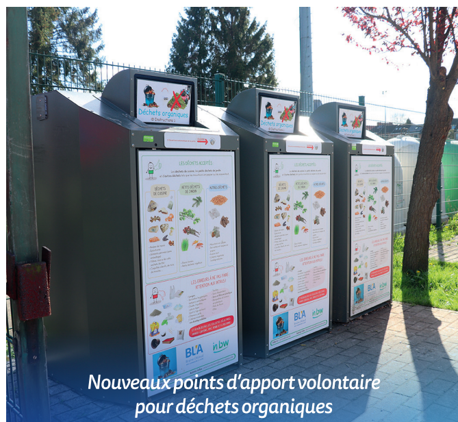
Nouveaux points d'apport volontaire pour déchets organiques