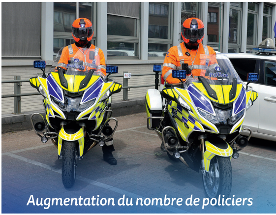
Augmentation du nombre de policiers