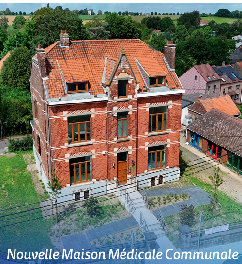
Nouvelle Maison Médicale Communale