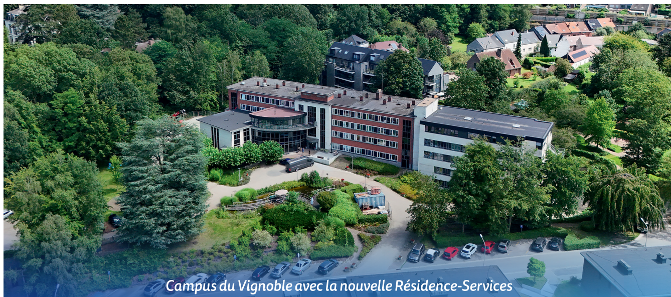
Campus du Vignoble avec la nouvelle Résidence-Services