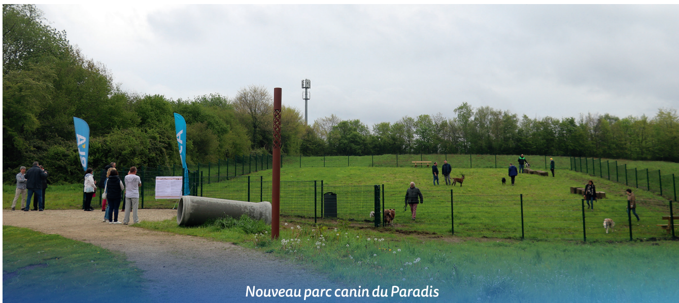
Nouveau parc canin du Paradis