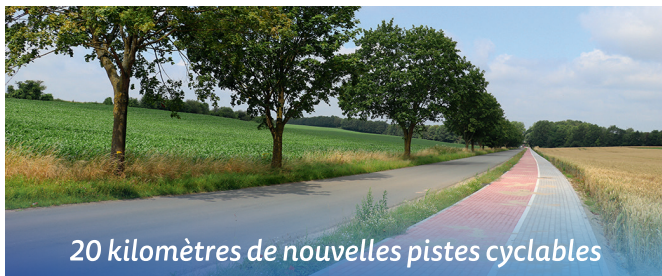
20 kilomètres de nouvelles pistes cyclables