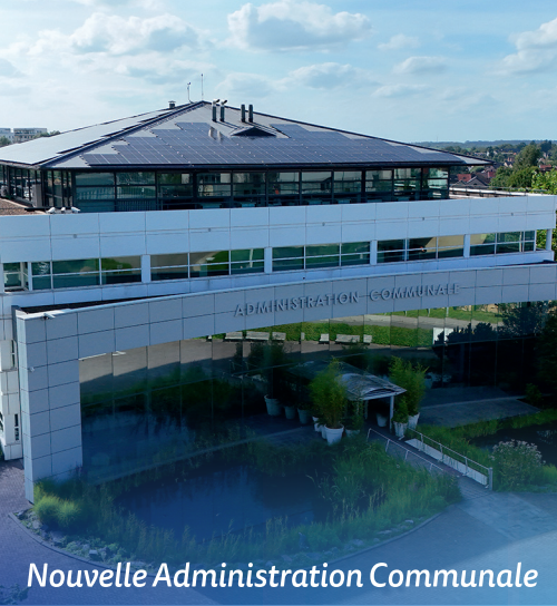
Nouvelle Administration Communale