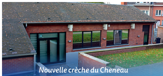
Nouvelle crèche du Cheneau