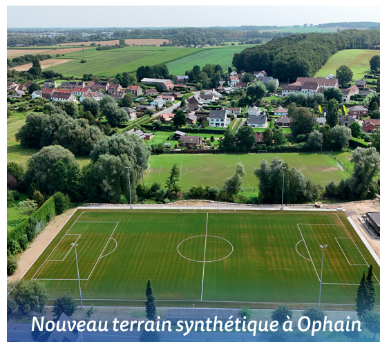
Nouveau terrain synthétique à Ophain