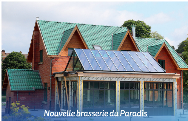
Nouvelle brasserie du Paradis