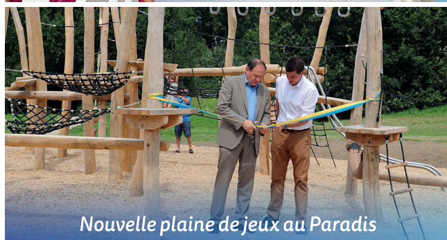
Nouvelle plaine de jeux au Paradis