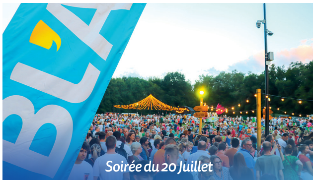
Soirée du 20 Juillet