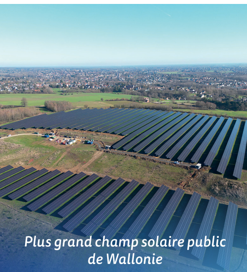
Plus grand champ solaire public de Wallonie